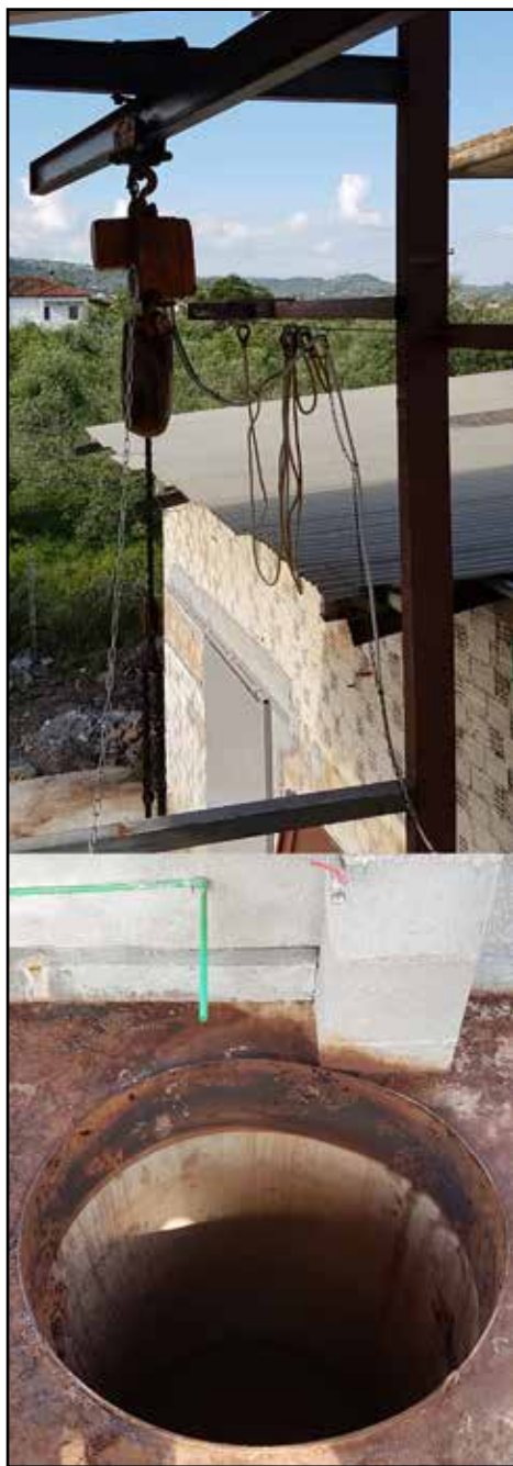
Med hjälp av en vinsch sänks briar-klossarna ner i hålet i golvet för att kokas i minst 16 timmar.